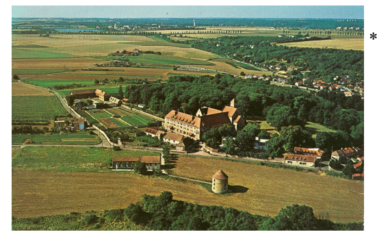
* Abbaye Saint-Louis du temple sur le Plateau de Saclay